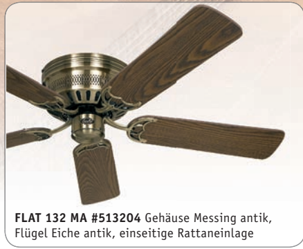
FLAT 132 MA #513204 Gehäuse Messing antik, Flügel Eiche antik, einseitige Rattaneinlage