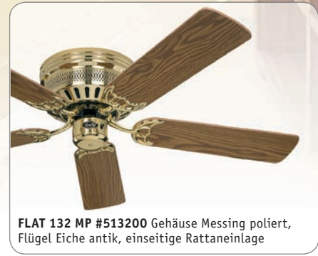
FLAT 132 MP #513200 Gehäuse Messing poliert, Flügel Eiche antik, einseitige Rattaneinlage