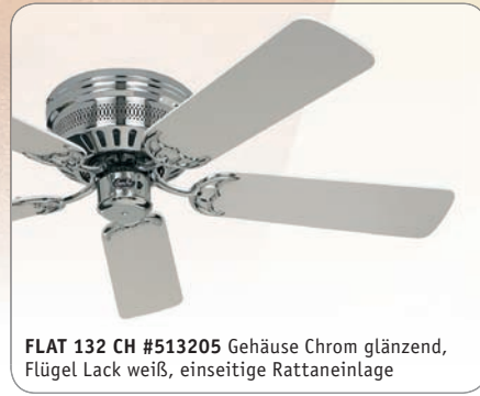
FLAT 132 CH #513205 Gehäuse Chrom glänzend, Flügel Lack weiß, einseitige Rattaneinlage