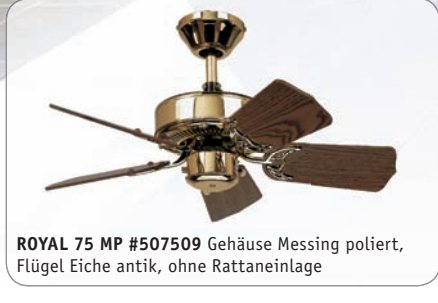
ROYAL 75 MP #507509 Gehäuse Messing poliert, Flügel Eiche antik, ohne Rattaneinlage