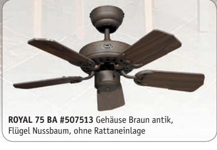
ROYAL 75 BA #507513 Gehäuse Braun antik, Flügel Nussbaum, ohne Rattaneinlage