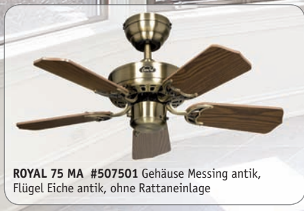
ROYAL 75 MA #507501 Gehäuse Messing antik, Flügel Eiche antik, ohne Rattaneinlage