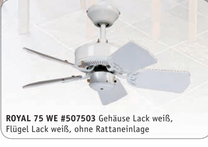
ROYAL 75 WE #507503 Gehäuse Lack weiß, Flügel Lack weiß, ohne Rattaneinlage