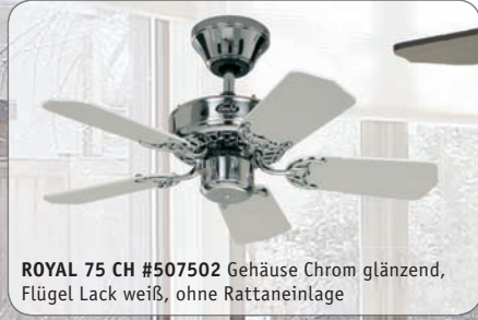
ROYAL 75 CH #507502 Gehäuse Chrom glänzend, Flügel Lack weiß, ohne Rattaneinlage