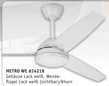
METRO WE #24218 Gehäuse Lack weiß, Wende- flügel Lack weiß (sichtbar)/Ahorn