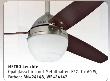
METRO Leuchte Opalglasschirm mit Metallhalter, E27, 1 x 60 W, Farben: BN=24148, WE=24147