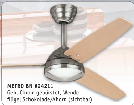
METRO BN #24211 Geh. Chrom gebürstet, Wende- flügel Schokolade/Ahorn (sichtbar)