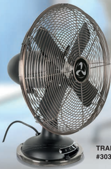
TRADITION TV 30 II MS #303053